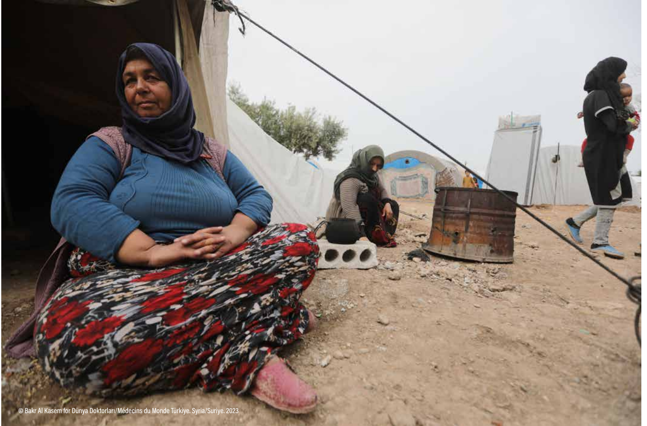
Syria/Suriye. 2023