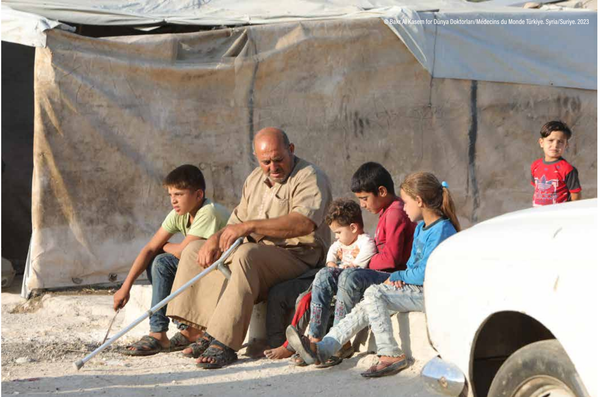
© Bakr Al Kasem for Dünya Doktorları/Médecins du Monde Türkiye. Syria/Suriye. 2023