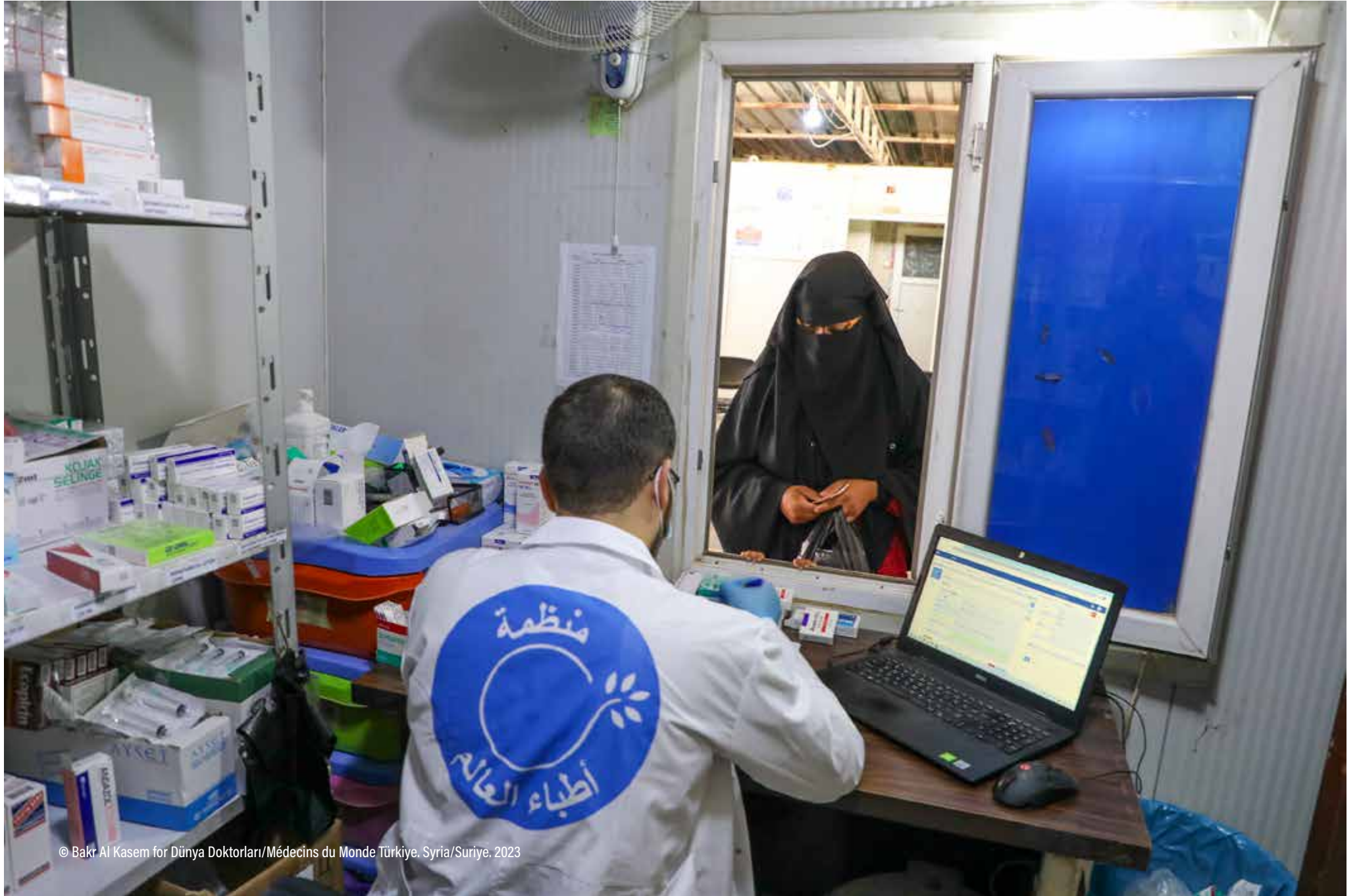
© Bakr Al Kasem for Dünya Doktorları/Médecins du Monde Türkiye, Syria/Suriye, 2023