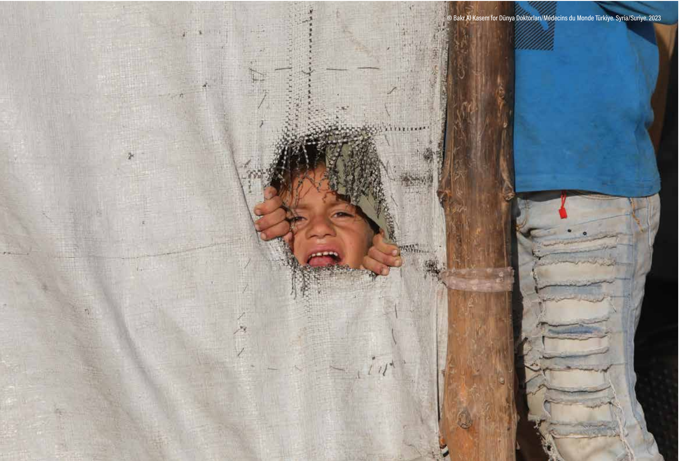
Syria/Suriye. 2023