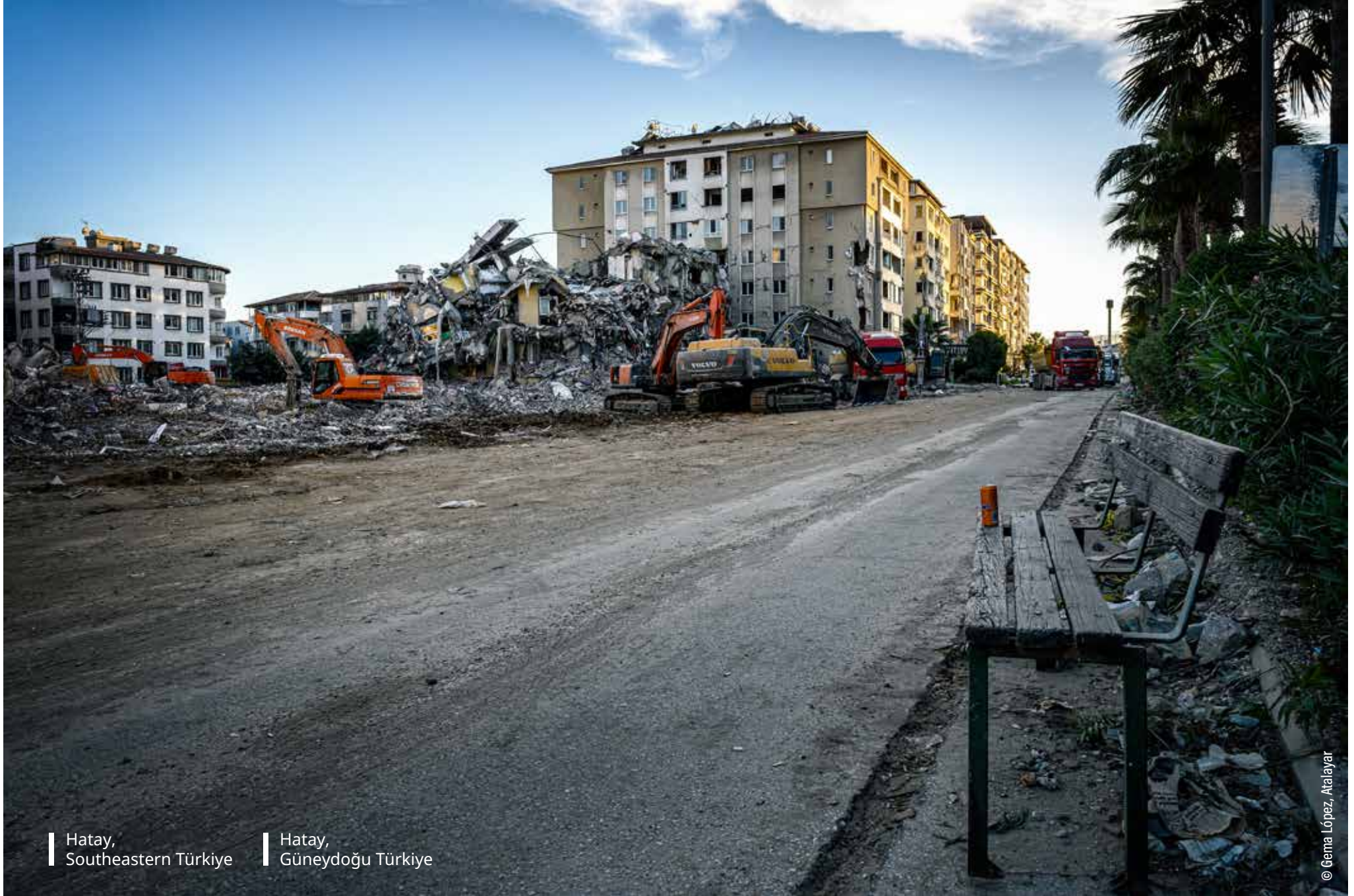
Hatay, Southeastern Türkiye